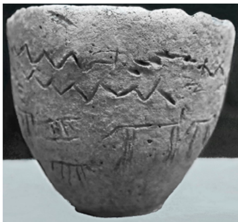
Рис. 2. Сосуд из с. Полянки. Срубная культура, середина II тыс. до н.э. Национальный музей Республики Татарстан.