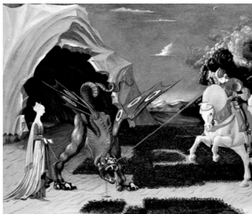
Рис. 3. Паоло Уччелло. Битва святого Георгия с драконом. 1460 г. Лондон. Национальная галерея.