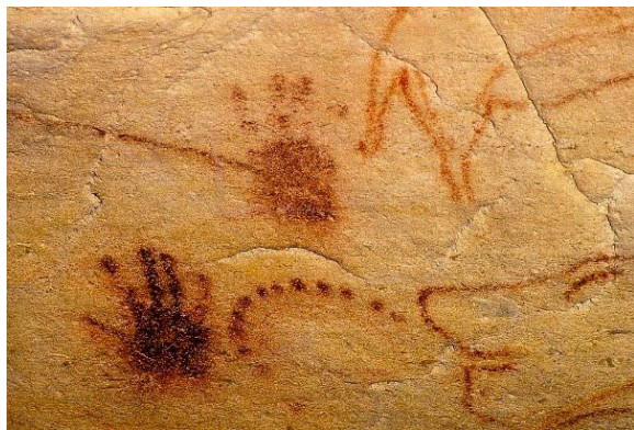
Рисунок 2. Изображения в пещере Шове. Фрагмент панели красных знаков в «галерее рук».

Хотя энтлоптические феномены находятся в самом начале спектра состояний измененного сознания, они сохраняются и на третьей стадии – глубокого транса [9]. Здесь они сочетаются с иконическими изображениями людей, животных и монстров. Таким образом, они становятся неотъемлемой частью мира духов, независимо от того, каковы их специфические значения, установленные культурой. Мы утверждаем, что здесь находится ответ на загадку происхождения некоторых геометрических наскальных рисунков, а также, что волнует нас много более, на загадку сочетания геометрических и предметных изображений в искусстве верхнего палеолита (рис. 2). Вместе эти два вида изображений образуют единое целое. Все они являются частью духовного опыта и их расположение на стенах-мембранах глубоких пещер больше не вызывает удивления.