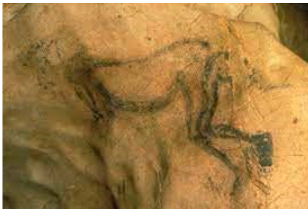
Рисунок 3. «Колдун» был создан около 13 000 лет до н. э. Изначально был воспринят как изображение первого божества, современные исследователи склонны усматривать в рисунке фигуру шамана, который выполняет ритуал.

тической резьбы относится к ориньякскому периоду (около 35 000 – 28 000 до н. э.). Это человек с кошачьей, вероятно, львиной головой. Раскрашенные и гравированные териантропы известны также с заключительного периода верхнего палеолита – мадленского (16 000 – 11 000 до н.э.) «Колдун» из Пещеры трех братьев, возможно, является самым известным териантропом верхнего палеолита (рис. 3). В недавно открытой пещере