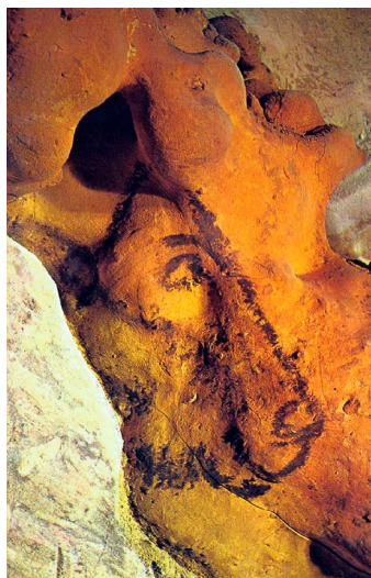
Рисунок 1. Голова лошади. Остальная часть животного, как может представиться наблюдателю, находится за скалой. Руффиньяк, департамент Дордонь, Франция

Многие изображения включают в себя особенности поверхности, на которой они размещены. Иногда глазом животного становилась небольшая конкреция; естественная выпуклость скалы превращалась в грудь или плечо животного, край выступа оказывался