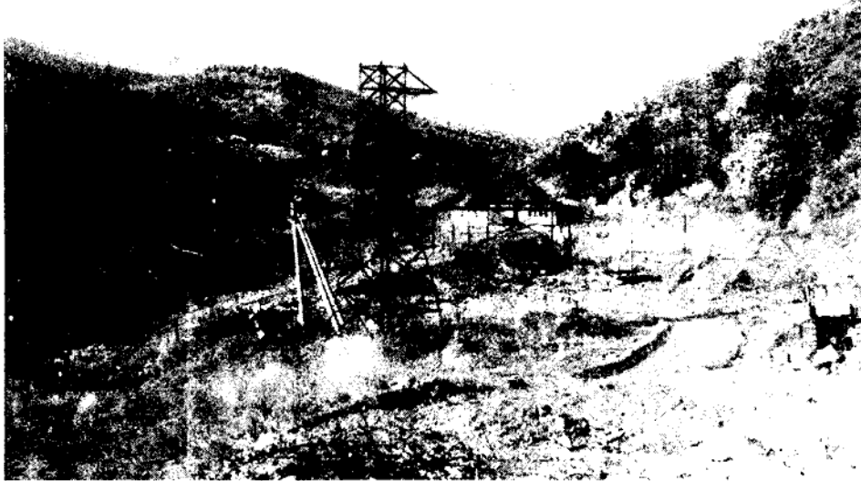
Рис. 2 Строящееся водохранилище на р. Улу-Узень Восточный

р. Дерекойка водная фауна представлена исключительно личинками хирономид, этому также в значительной степени способствовало спрямление русла реки.