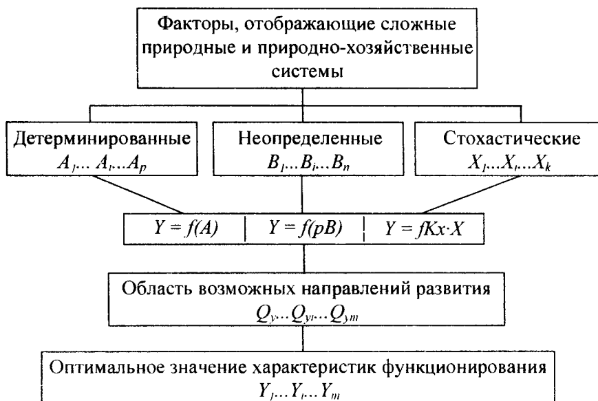
Рис.1. Структура экспертного метода исследования

Экспертный метод, все в большей степени используется в научных исследованиях и производственной деятельности, а с углублением наших представлений о реальном мире роль его будет возрастать.