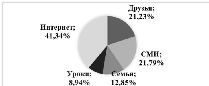
Рис. 1. Источники получения информации общественно-политического характера