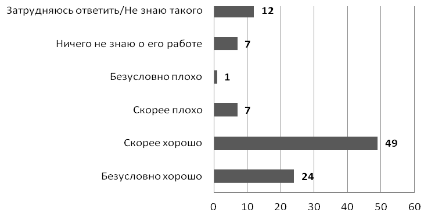
Рис.2. Ответ на вопрос «Сергей Аксенов работает главой Республики уже почти 4 года. Если оценивать все направления его деятельности, то, как Вы считаете, как он работает, справляется со своими обязанностями: хорошо или плохо?»

Очевидно, что выявленные показатели отличаются устойчивостью и подавляющим доминированием над другими оценками. Подтверждаются они и оценкой со стороны крымчан работы главы Республики С. Аксенова. О том, что глава республики должен остаться на своей должности заявили в январе 2018 года 76% опрошенных, и 73% крымчан отметили, что он хорошо справляется со своими обязанностями [13].